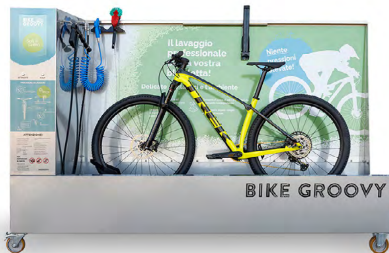
BikeGroovy orientato a destra con l'adesivo in italiano

BikeGroovy si può inoltre personalizzare in base alle condizioni ed esigenze specifiche. Sia dal punto di vista strutturale (orientamento a destra o a sinistra) che della lingua (dell'adesivo) e del design.